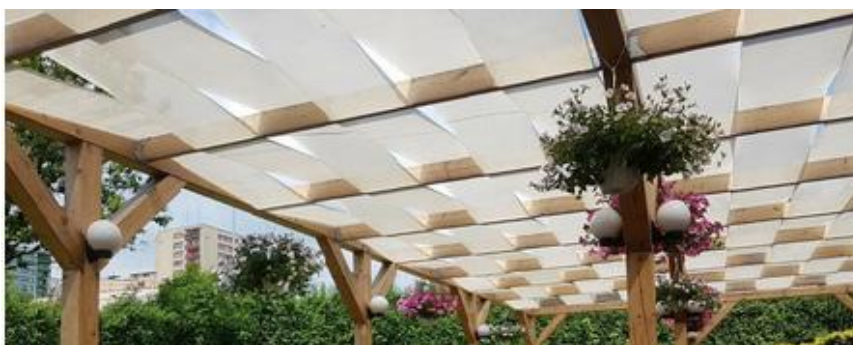
Rysunek 1. Pasy altanowe na konstrukcji.