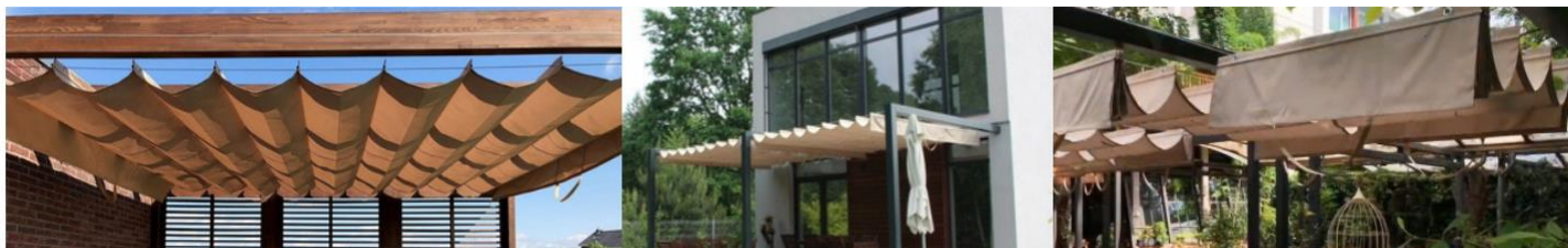
Rysunek 1. Roleta rzymska a) na konstrukcji ramowej drewnianej b) na poprzeczkach stalowych c) na konstrukcji metalowej