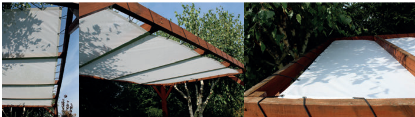
Rysunek 1. Dach żąglowy na konstrukcji