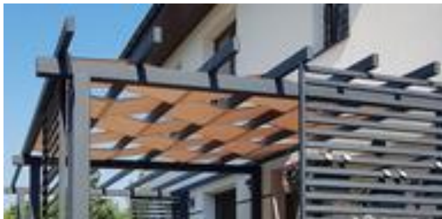
Rysunek 1. Pasy altanowe z materiału Premium Decor