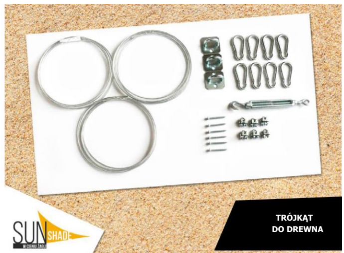
TRÓJKĄT DO DREWNA