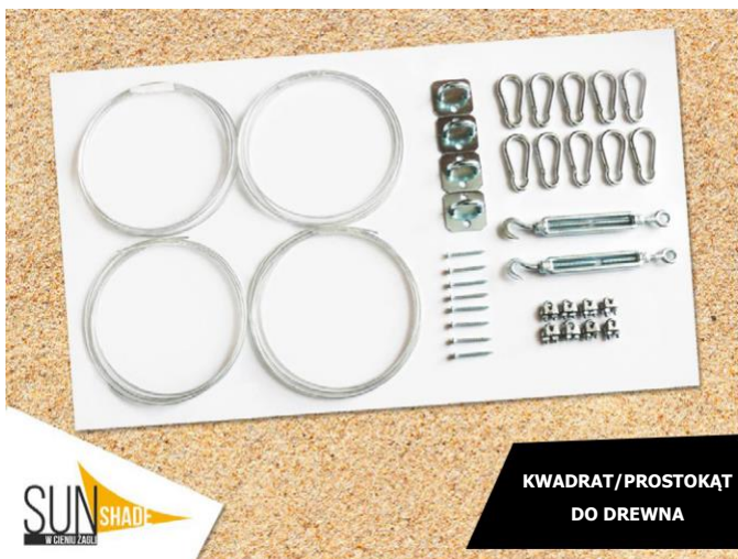
KWADRAT/PROSTOKĄT DO DREWNA