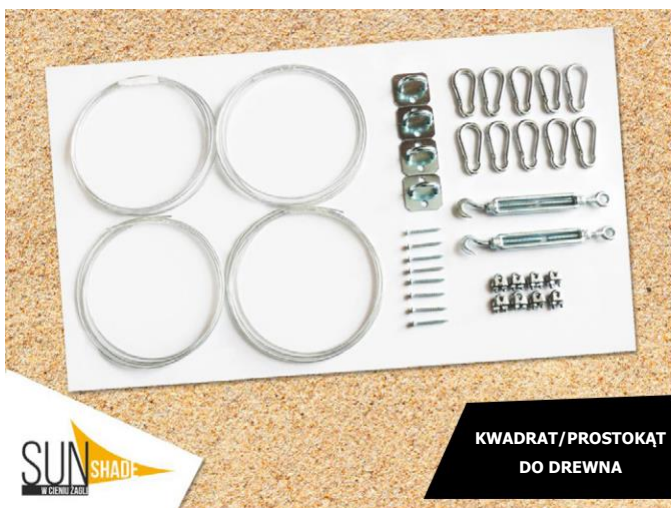
KWADRAT/PROSTOKĄT DO DREWNA