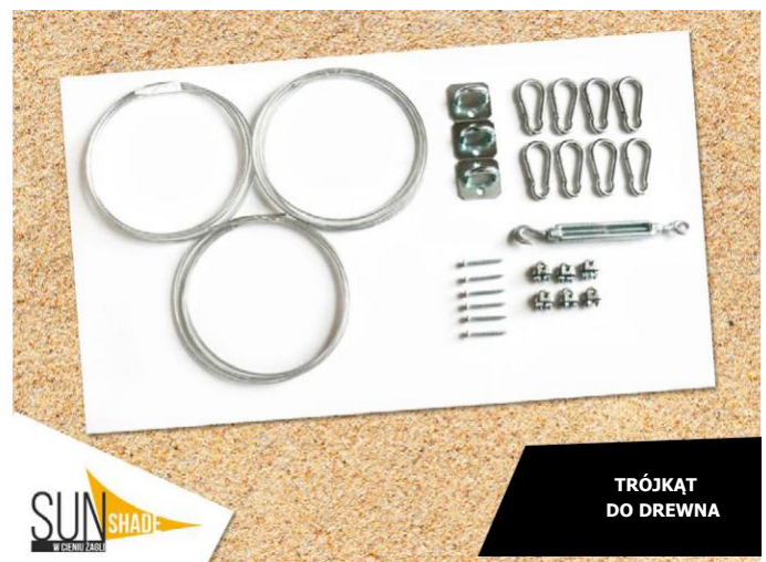
TRÓJKĄT DO DREWNA