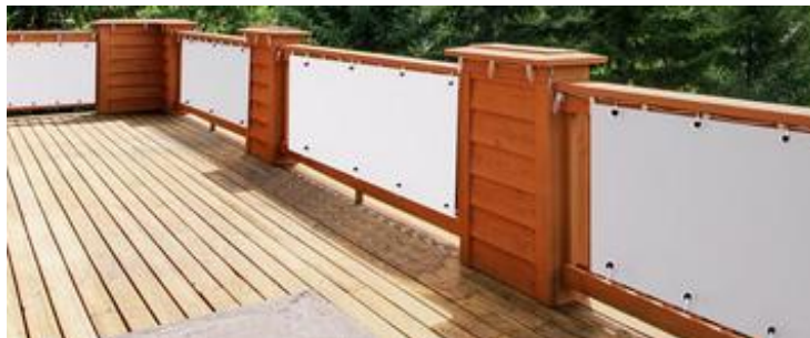
Rysunek 1. Osłona balkonowa