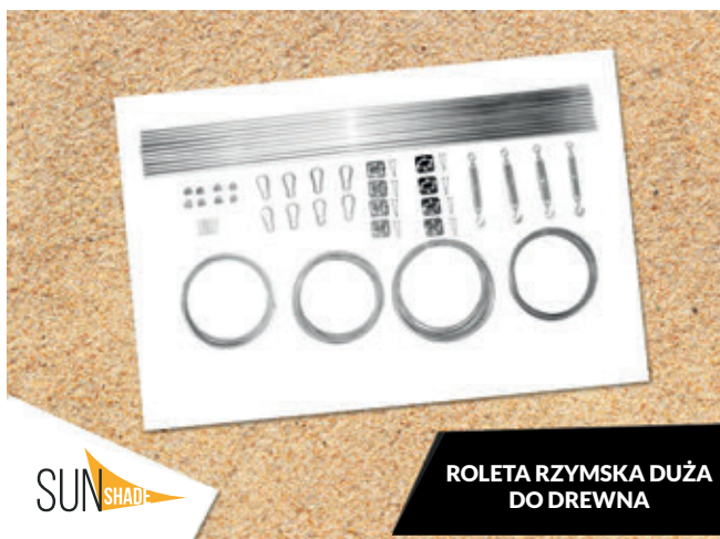
ROLETA RZYMSKA DUŻA DO DREWNA