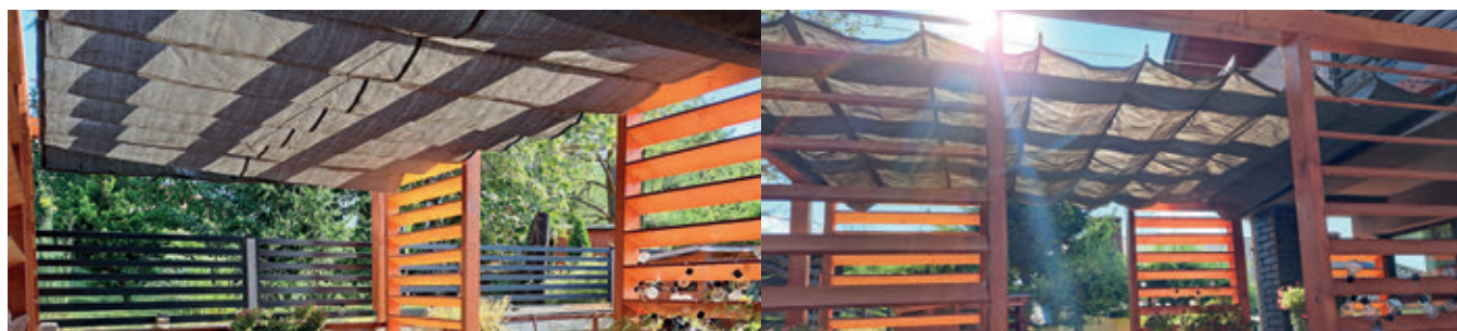
Rysunek 1. Rolety na konstrukcji