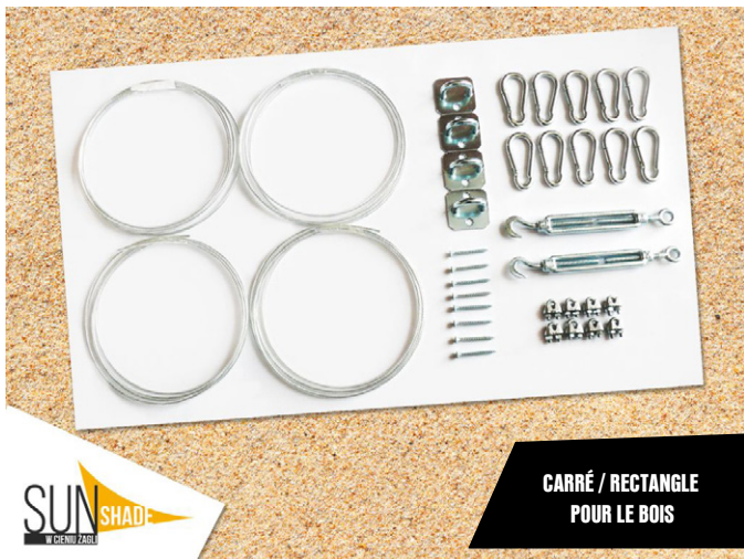
CARRÉ / RECTANGLE POUR LE BOIS