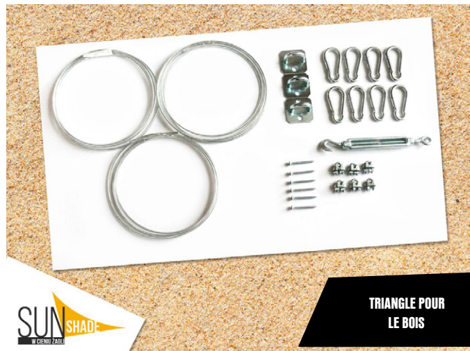
TRIANGLE POUR LE BOIS