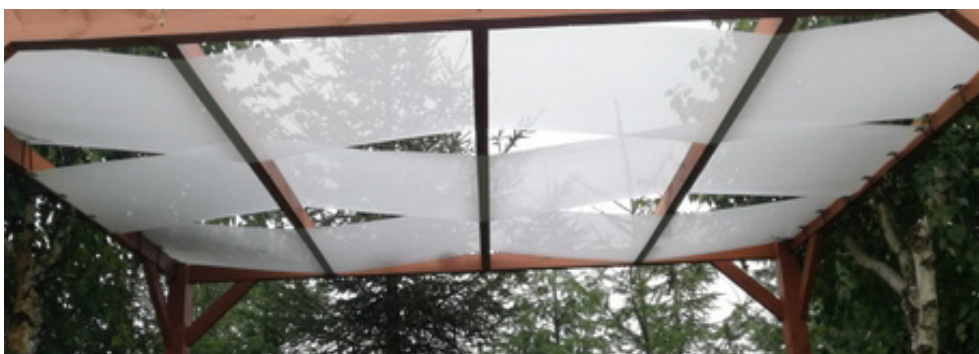
Fig. 2 Mode de montage des bandes proposé.