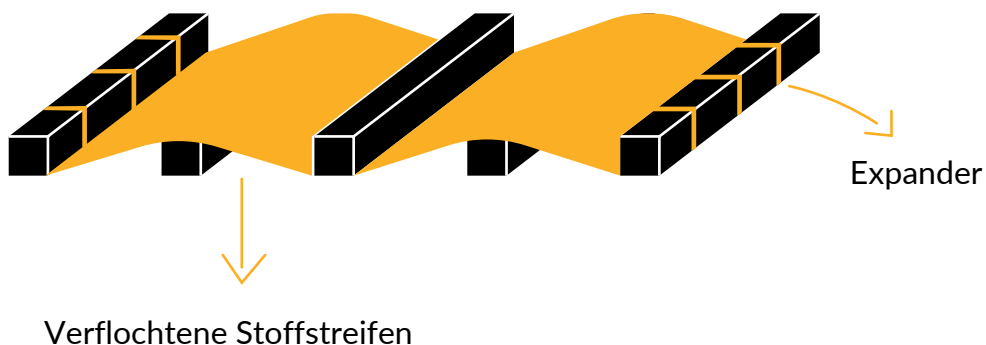
Abb. 2. Vorgeschlagene Methode zur Installation dieses Sonnenschutzes